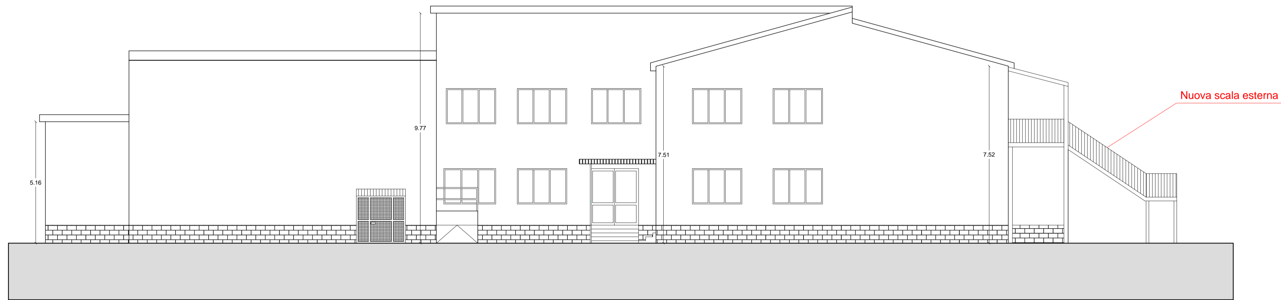
Prospetto Sud - Ovest