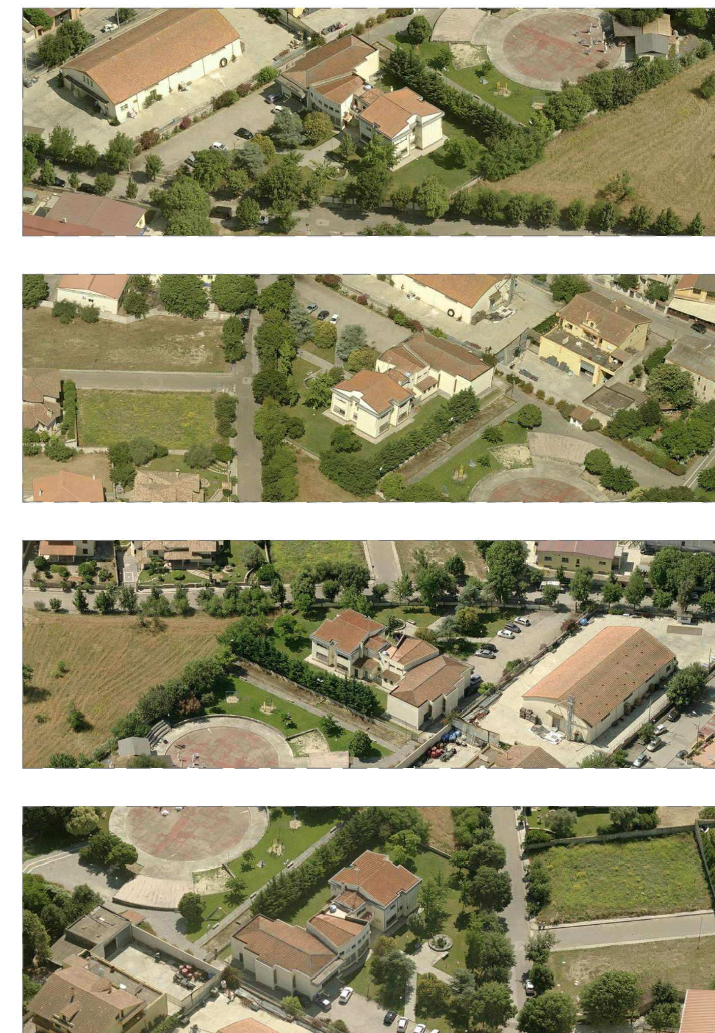
FOTO OBLIQUE -fuoriscala

NOTE GENERALI - Valutare con impiantisti e strutturisti le formetrie nelle murature - Tutte le quote sono espresse in metri salvo diversa, specifica annotazione - Eventuali discordanze tra quote parziali e relative quote totali sono da attribuirsi all'arrotondamento decimale adottato - Le quote altimetriche sono espresse in mt. salvo diversa, specifica annotazione - Tutte le misure e quote sono da controllare e verificare in cantiere. Eventuali errori o divergenze vanno riportate alla D.L. prima della esecuzione delle opere - Considerare le misure e le quote indicate nella tavola, non rilevare graficamente - Questo disegno deve essere verificato in associazione a tutti i disegni ed indicazioni strutturali ed impiantistiche - Per posizionamento e dimensione di fori o tubi fare riferimento anche alle tavole impiantistiche e strutturali, eventuali divergenze vanno riferite alla D.L. prima di eseguire le opere - Per i dettagli delle finiture vedere anche le relative specifiche tavole architettoniche - Per la disposizione degli intonaci esterni e relative scelte cromatiche vedere le tavole dei prospetti o chiedere espresse indicazioni alla D.L.