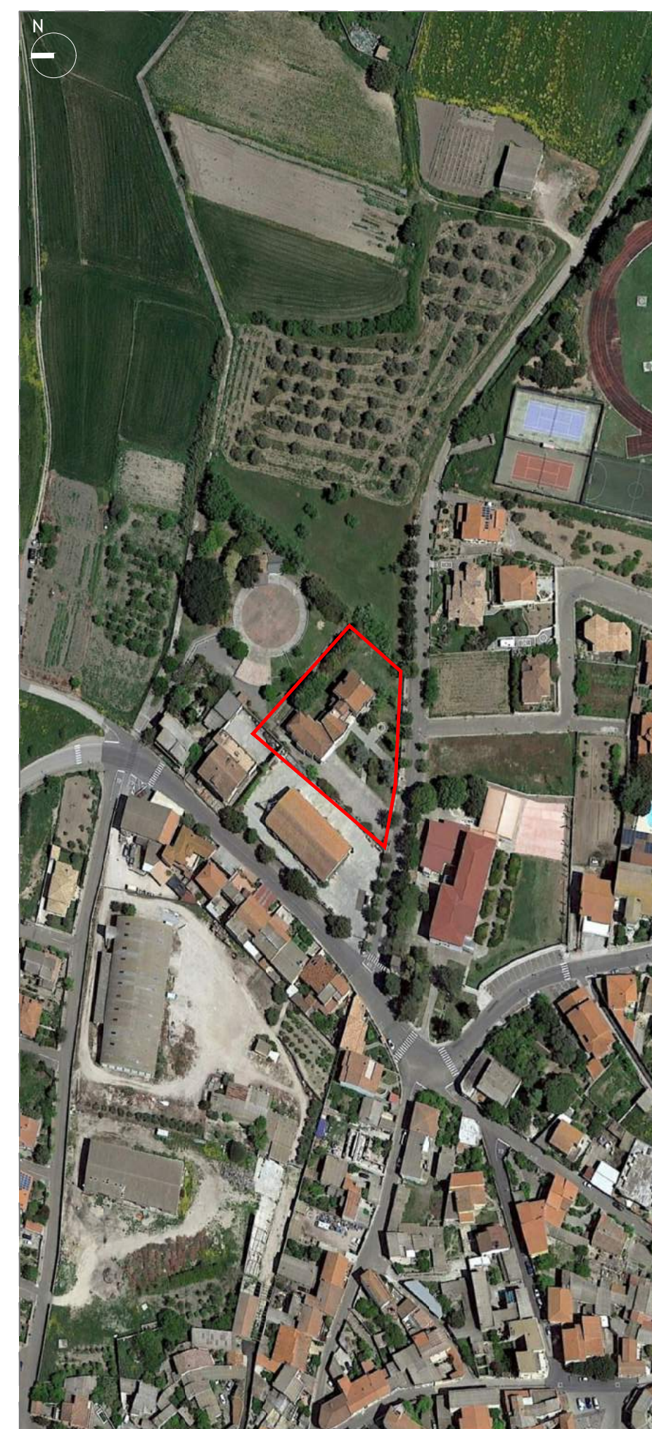
ORTOFOTO _ A1 1:2000 - A3 1:4000